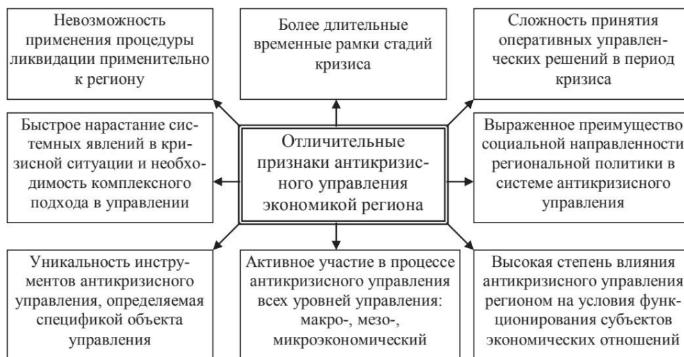
Рисунок 1 – Отличительные признаки антикризисного управления региона [13]

Анализ литературы по теме исследования, позволил представить характерные черты антикризисного управления на уровне региона (Рис. 1).